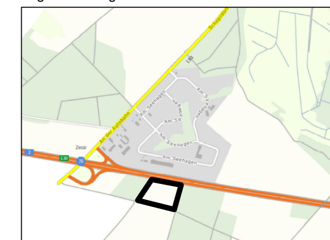
Lage des Plangebietes

2.1.2 Die Mahd der mit Landschaftsrasen anzusäenden Flächen soll außerhalb der Nist-, Brut- und Aufzuchtzeit von bodenbrütenden Vogelarten ein- bis max. zweimal jährlich erfolgen. Alternativ ist auch eine Beweidung möglich. Der Einsatz von Düngemitteln und Pestiziden ist nicht erlaubt. Dies soll mittels städtebaulichen Vertrag gesichert werden.